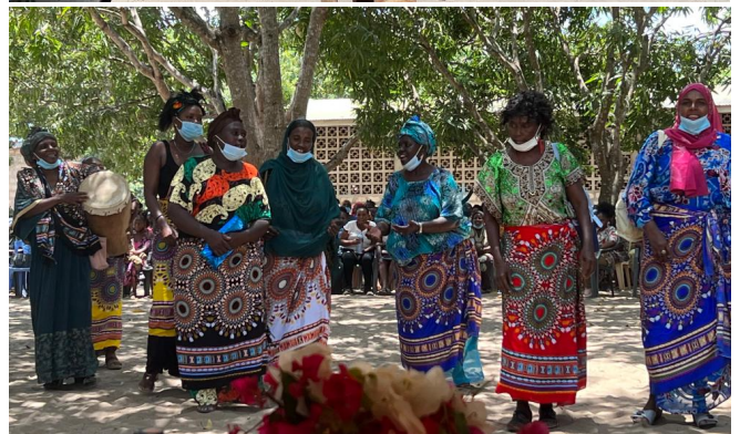
AUGURIII 15 anni Bambakofi Academy 25 anni ATKYE