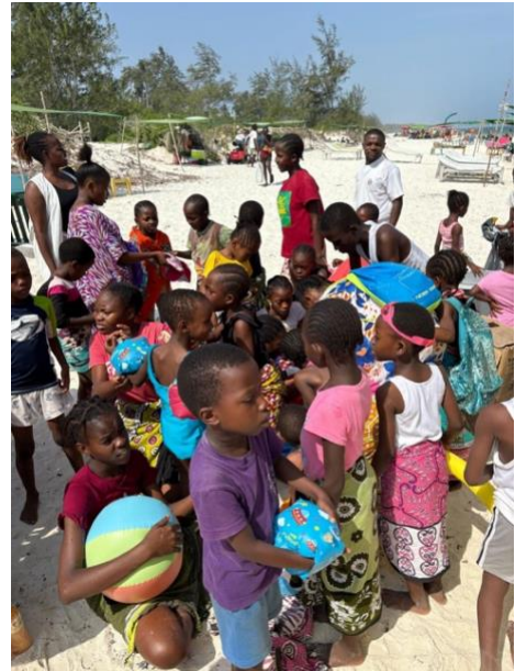
Che gioia al mare!