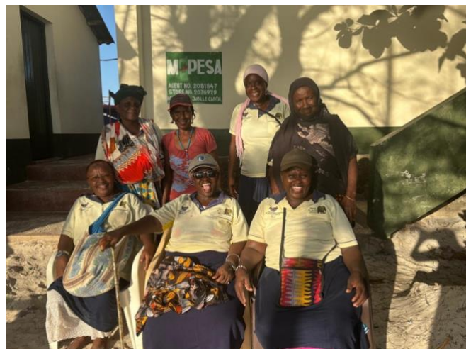
Le signore della spiaggia Blue Bay dove facciamo gli acquisti x i mercatini