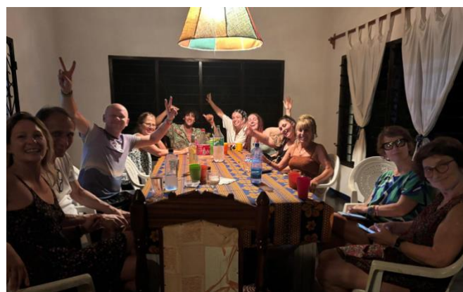
Serata a Casa Sunflower col pesce alla griglia ...