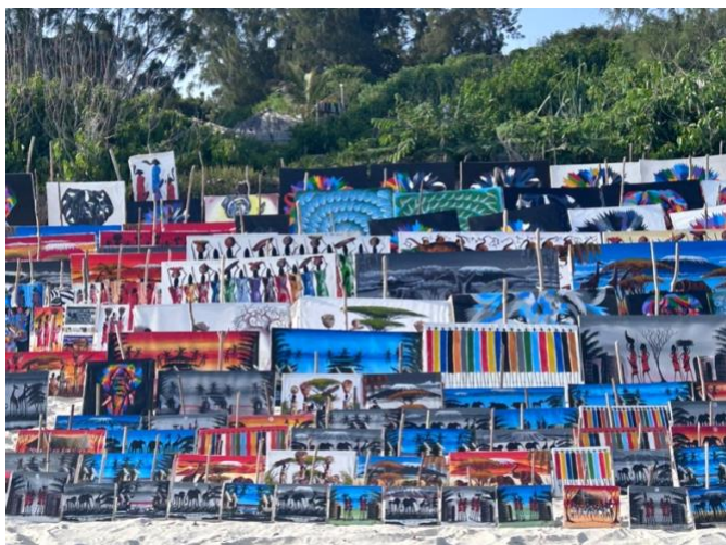
Arte in spiaggia