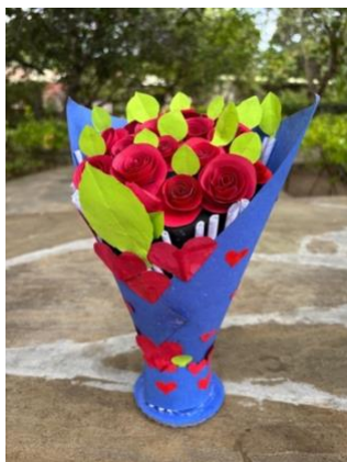
Le rose di carta per San Valentino